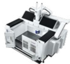
ENDURA® 900LINEAR KOMPAKT-PORTAL- FRÄSMASCHINE