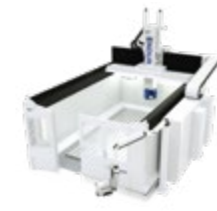
ENDURA® 600LINEAR PORTALFRÄSMASCHINE