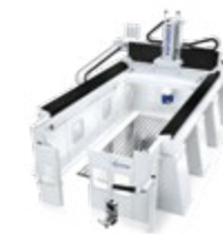
ENDURA® 900LINEAR PORTALFRÄSMASCHINE