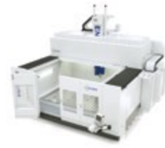
ENDURA® 7000LINEAR KOMPAKT-PORTAL- FRÄSMASCHINE