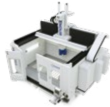
ENDURA® 700LINEAR KOMPAKT-PORTAL- FRÄSMASCHINE