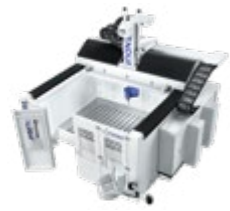
ENDURA® 400LINEAR KOMPAKT-PORTAL- FRÄSMASCHINE